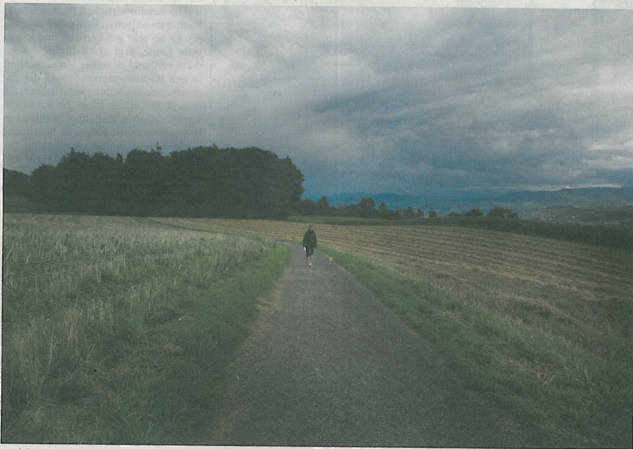
Auf dem Panoramaweg oberhalb von Herrliberg und oberhalb des Sees, mit Blick in Richtung Rapperswil.