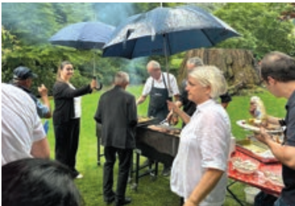
Schirmservice für die FAiR-Mitglieder am Grill – das Wetter spielte leider nicht mit.