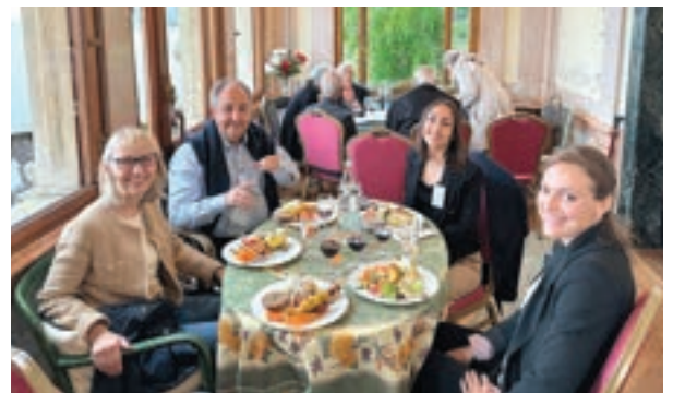
Begehrte Plätze im Trockenen – im Pavillon, der aufwendig restauriert wurde.