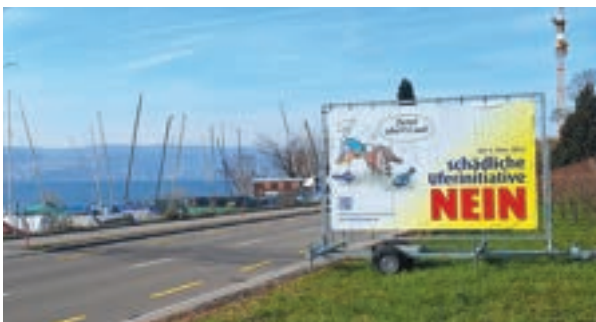
Das Plakat mit der Ente war omnipräsent – hier in Stäfa.